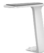
Fixe T-Armlehne, weiß