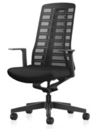
Drehstuhl, Rücken netzbespannt