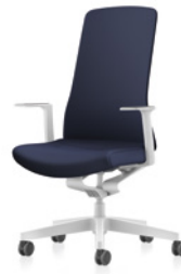
Drehstuhl, Rücken gepolstert

PURE IS3 passt perfekt in jedes Umfeld. Sein klares Design und die große Auswahl an Farben und Stoffen lassen viel Freiheit für eine individuelle Gestaltung. Die Kollektion umfasst vier Drehstuhlmodelle: Netz- und Polsterrücken, jeweils in weißem und schwarzem Design. Dabei kann aus einer Vielzahl an Materialien und Farben ausgewählt werden. Smart Spring, Stuhlsäule und die optionalen Armlehnen sind bei allen Modellen einheitlich entweder in Weiß oder Schwarz gehalten. Zur Auswahl stehen fixe T-Armlehnen oder 3D T-Armlehnen, die fixe T-Armlehne besticht durch ihr schlankes Design, die 3D T-Armlehne überzeugt zudem funktionell und ist in Höhe, Breite und Tiefe verstellbar.