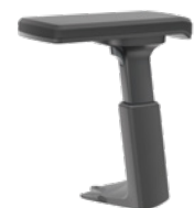
3D T-Armlehne, schwarz