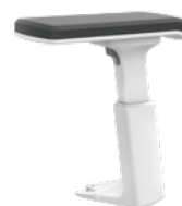
3D T-Armlehne, weiß