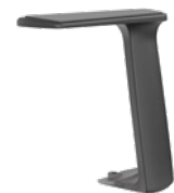
Fixe T-Armlehne, schwarz