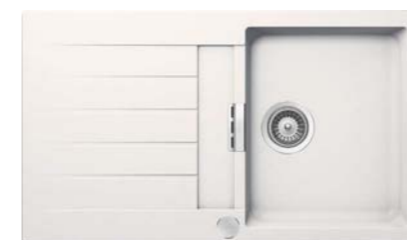
Cristadur Spüle – Schock Signus D 100